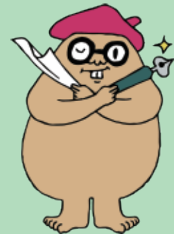
マグマシティPRキャラクター 火山の妖精 マグニオン