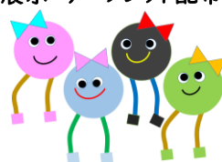
よかちゃん・らくちゃん 〈介護予防のうねりを起こす会作成〉