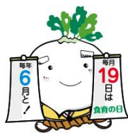
食育推進キャラクター でこん丸