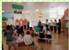
楽しいお話の世界