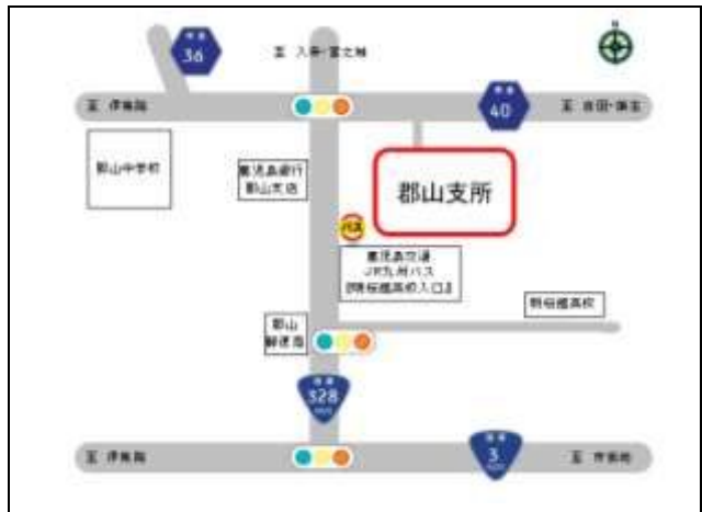
○郡山支所 (郡山町141番地)