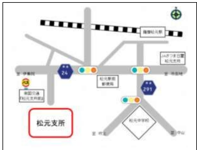
○松元支所 (上谷口町2883番地)