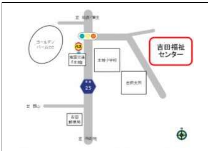
○吉田福祉センター (本城町1687番地2)