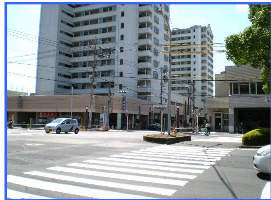
⑤ 外観(パース通り側)