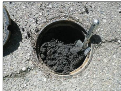
汚水桝内部の火山灰の堆積