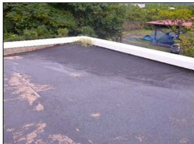
屋上の火山灰の堆積