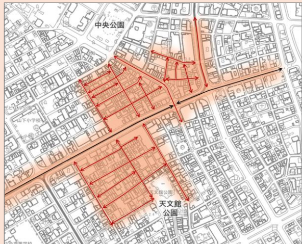
天文館の「主要商店街等の通り」