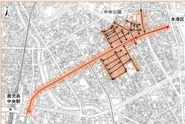
鹿児島中央駅から天文館、本港区までの「都市軸」