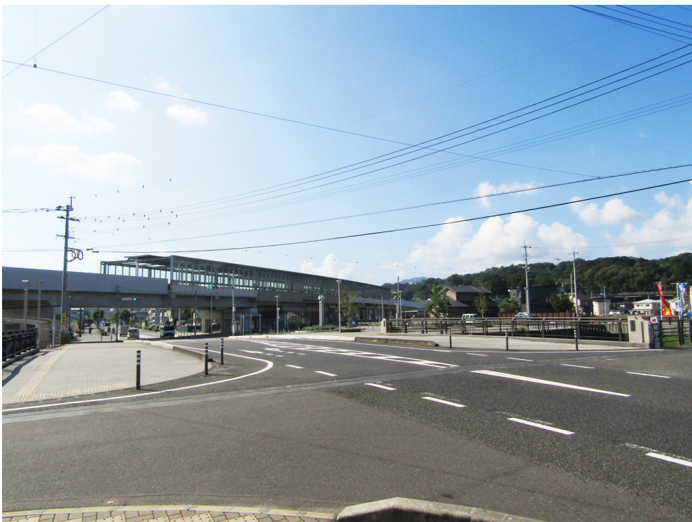
写真 7-2 御所下和田名線