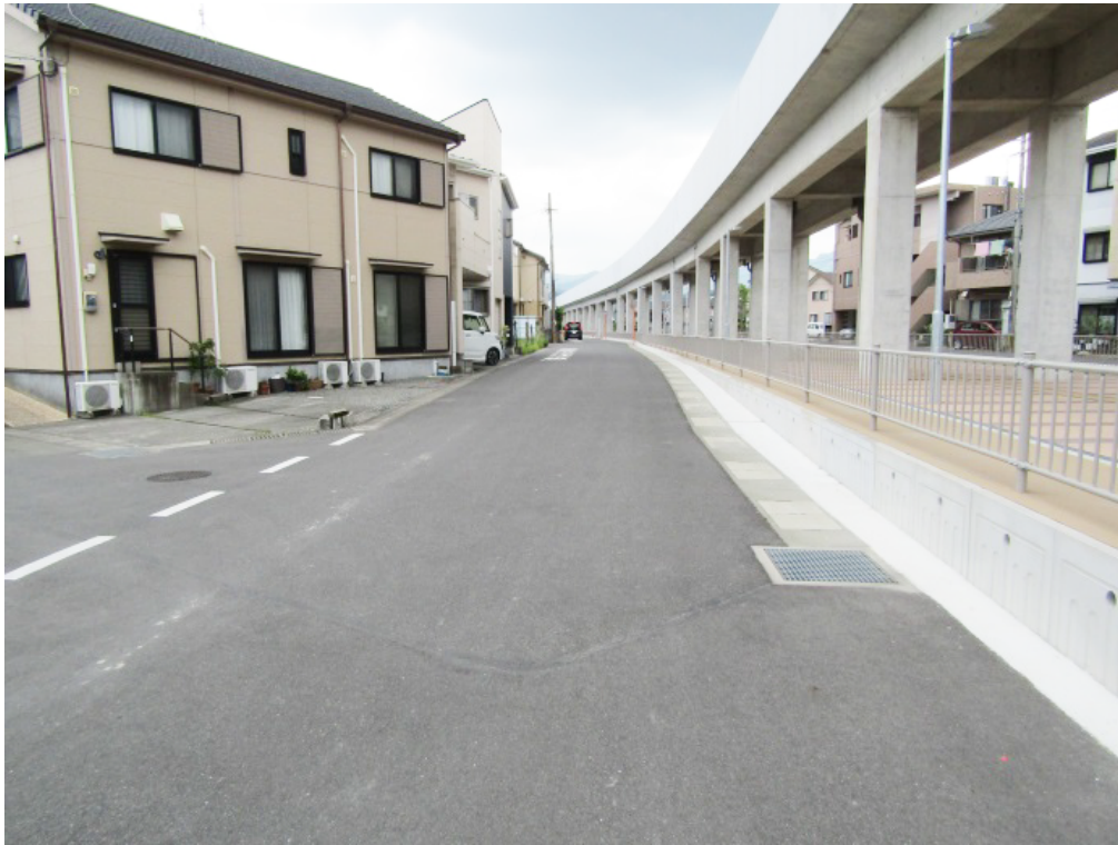
写真 7-3 住吉線