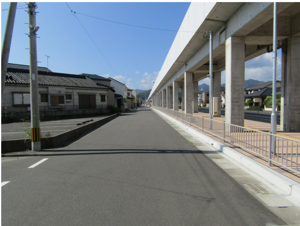
写真 7-4 大工田線