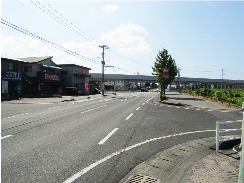
写真 7-1 惣福森山線