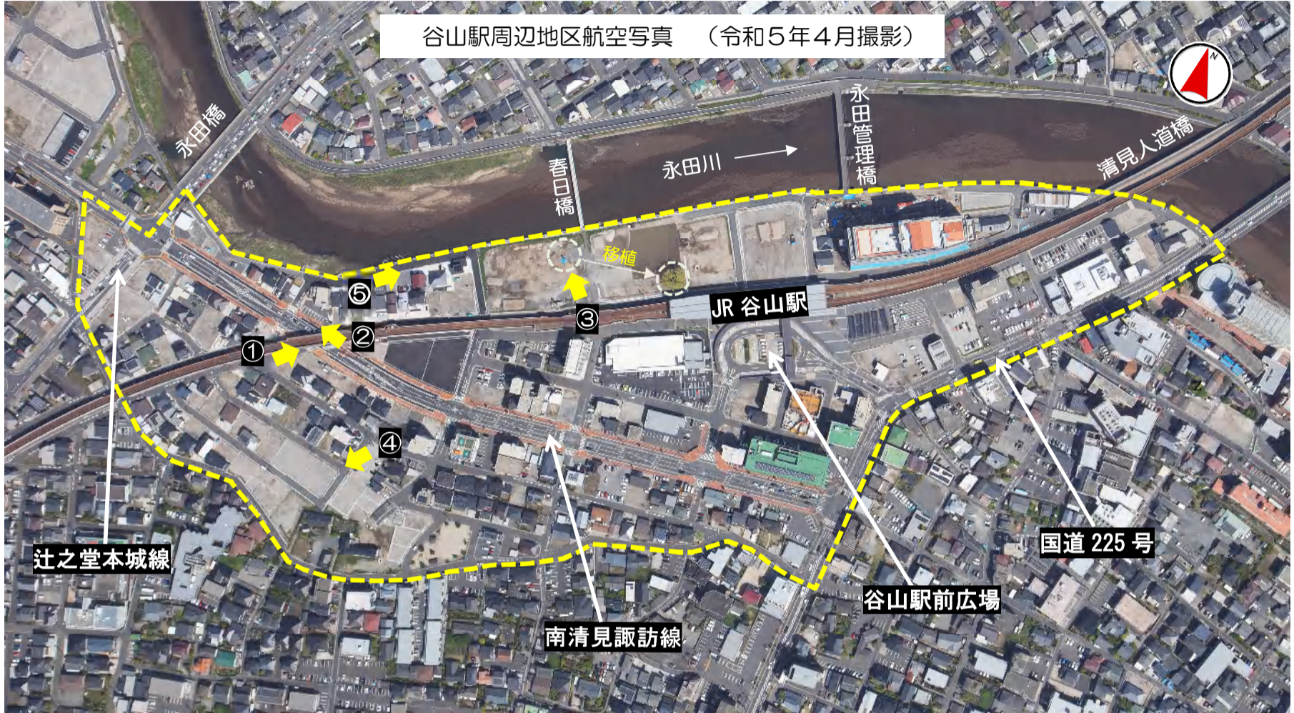
谷山駅周辺地区航空写真 (令和5年4月撮影)