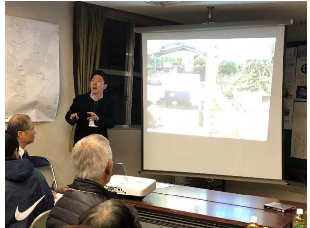
小山先生による講演

まち（団地）を知り、関係者がお互いを知る、まずは、そのための「 場づくり 」が 大切 です。