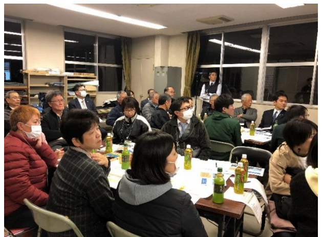
皆さん熱心に先生のお話を伺っています

西伊敷まちづくり協議会では、5月の総会に合わせて、「小山先生による特別講演会」を予定しています。