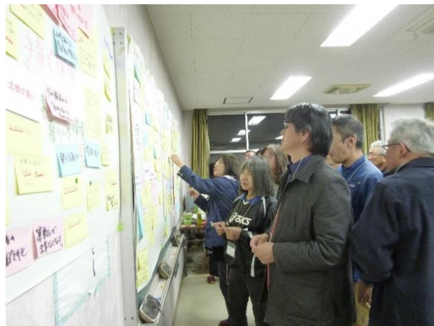
まとめ（投票）の様子