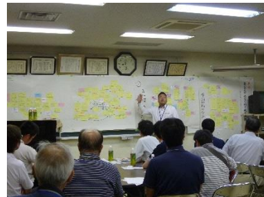
アイデアのまとめ