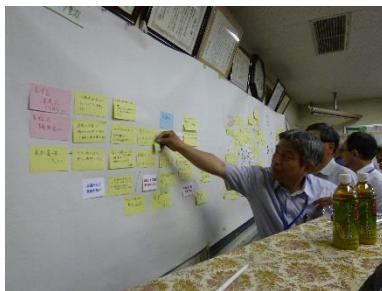
取組みアイデアへの投票