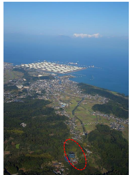
航空写真（地区の南側上空より桜島を望む）

日本の原風景を思わせる自然と調和したまちなみの中には、27km以上も離れた桜島を望める場所が地区内にあり、中世の山城と麓の関係を残した歴史的な雰囲気を感じることができる景観となっています。