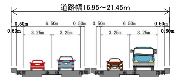
嵩上式 断面イメージ（橋梁部）