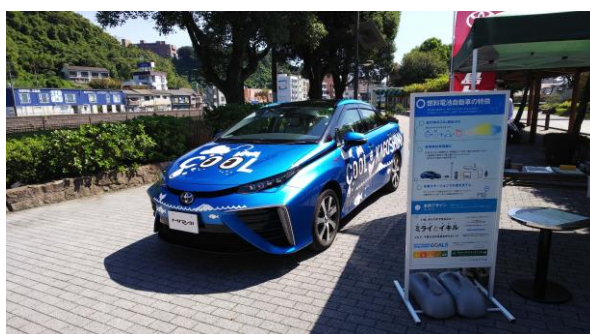
FCVの展示(かごしま環境未来館)