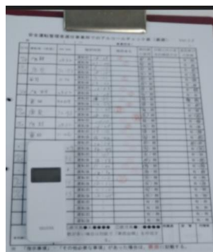
アルコール検知器と管理簿