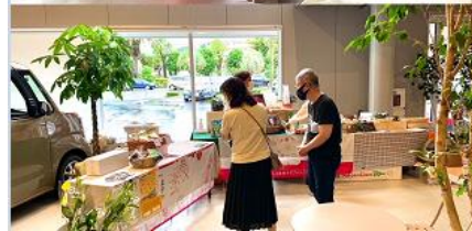
(農業女子プロジェクト)