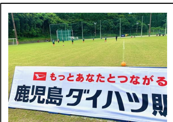
(小学校女子サッカー応援活動)