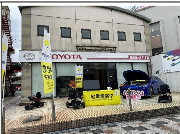
(災害時の給電実演)