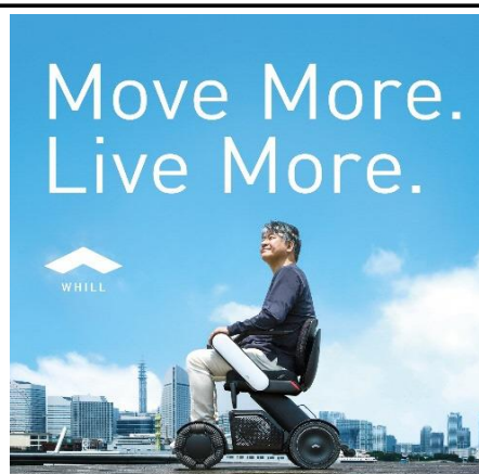
(免許不要のモビリティの提案)