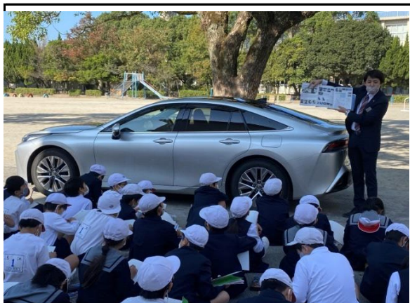
(小学校へ出張授業)