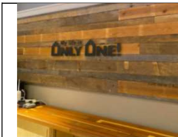
古材を使用したサービスカウンター後ろのパネル