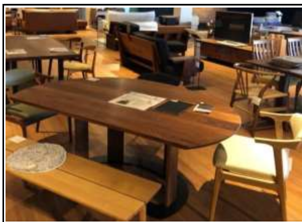
永くメンテナンスしながら使える家具を中心に取扱