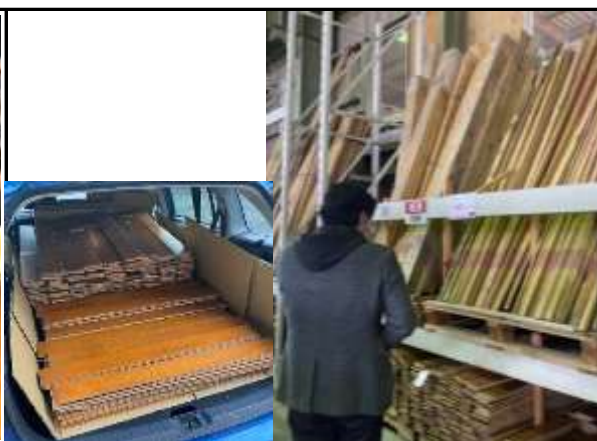
廃材を選定する様子