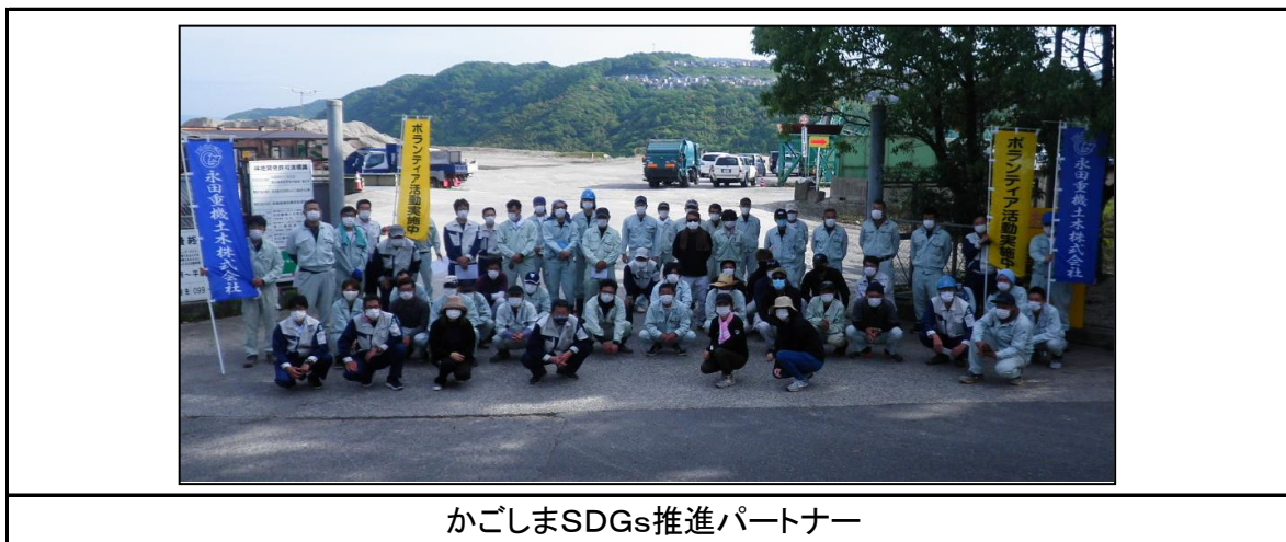
かごしまSDGs推進パートナー