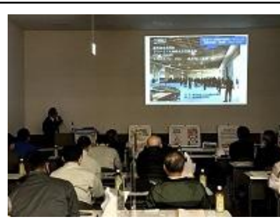
(セミナーによる脱炭素訴求)