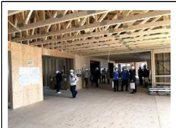
(木造施設見学会実施)