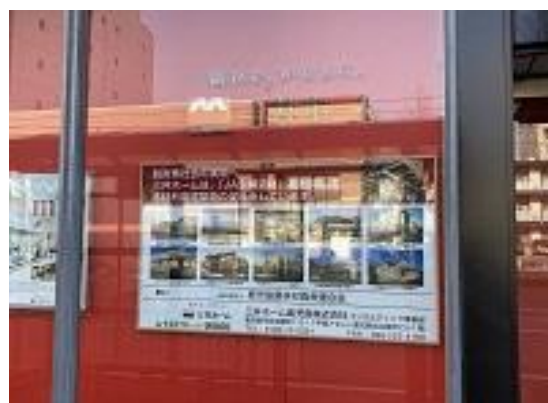
(本社看板による脱炭素訴求)