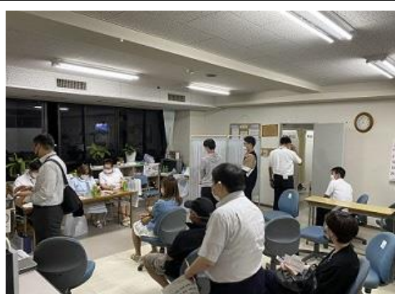
(従業員と家族の集団接種)