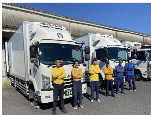
(免許資格 全額補助)