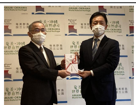
(奄美群島世界自然遺産基金寄附寄贈式)