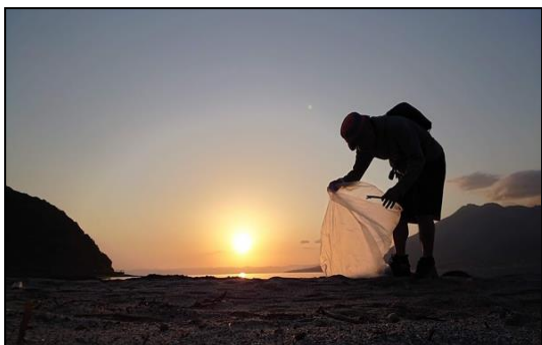
早朝磯海岸ゴミ拾い@ゴール14