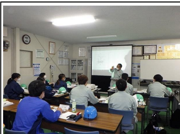
(社内学校・白眉実践塾での教育)