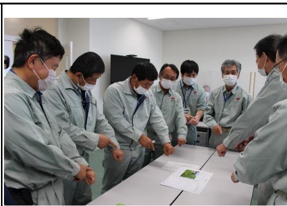
(雇用延長従業員が活躍できる組織編制・運用)