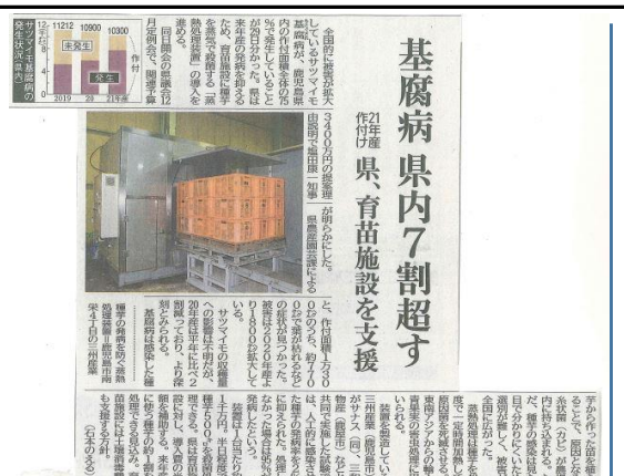
(サツマイモ基腐れ病への取り組み)南日本新聞社掲載