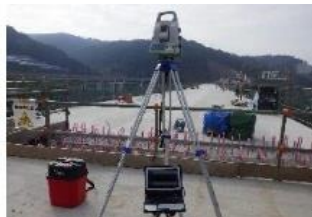
(3Dスキャン計測システム等の新技術の導入)