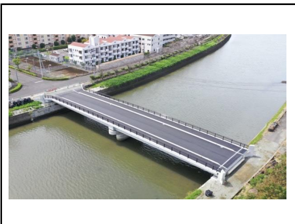
(プレストレストコンクリート技術を活かした橋梁の施工)