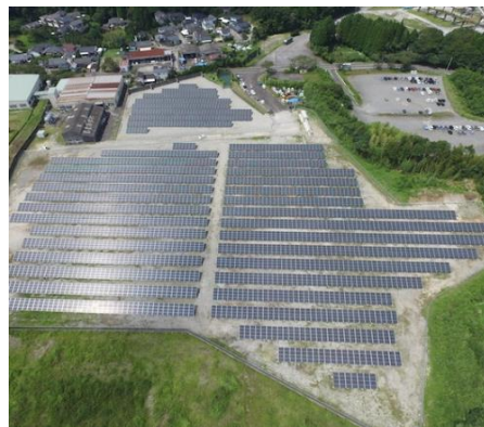
(太陽光発電への取り組み)