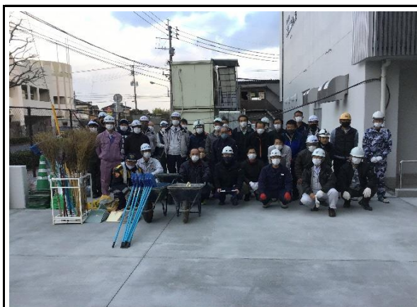
(清掃ボランティア活動の様子)