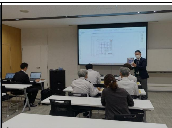
(外部講師を招いた定期的な社内研修の様子)