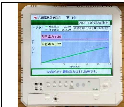
(デマンド監視装置にて本社ビル内電力を監視)