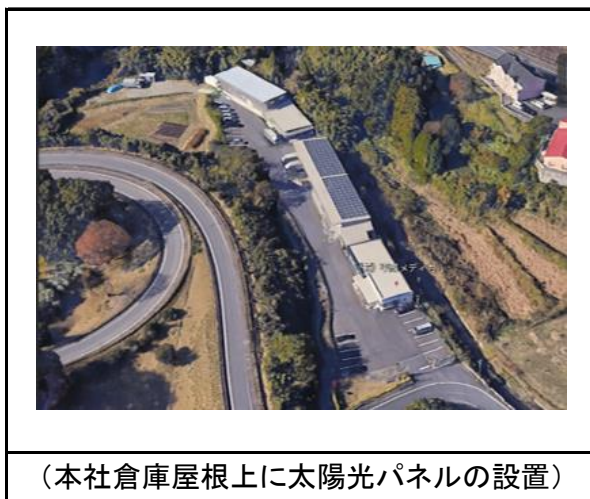
(本社倉庫屋根上に太陽光パネルの設置)