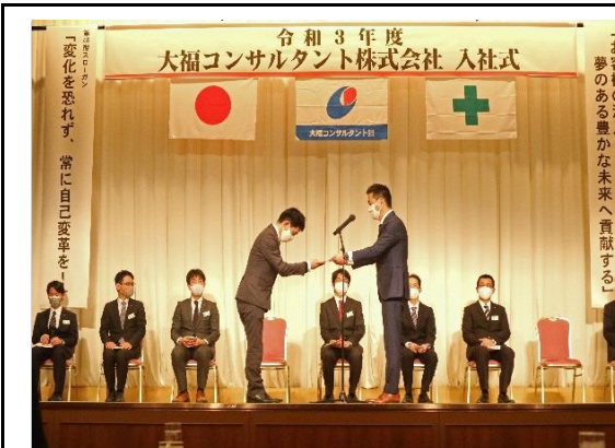
(資格取得者への報奨金授与)