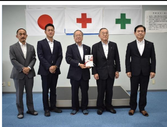
(日本赤十字への寄付)