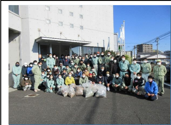
(ボランティア清掃の実施)