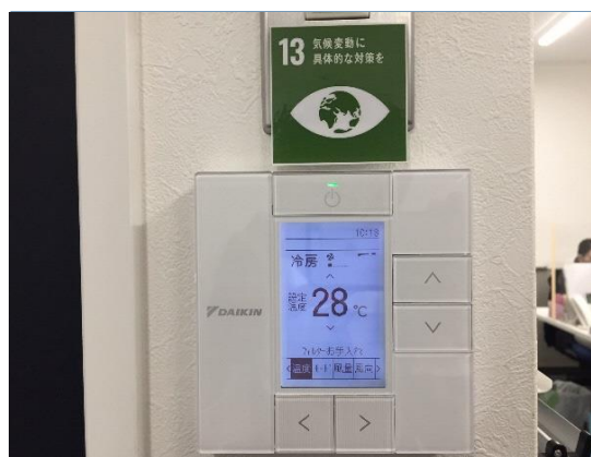
(関連するゴールを掲示)