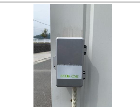
(デマンドコントロールでの節電)