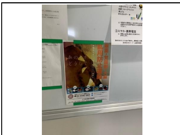
(麻薬防止ポスターの掲示)