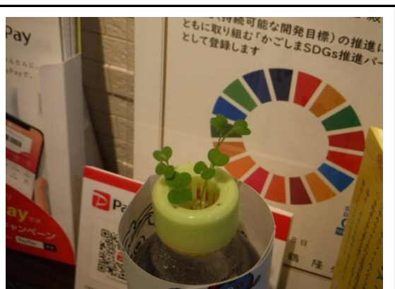
(生物多様性に基づく緑化活動 ルッコラ)