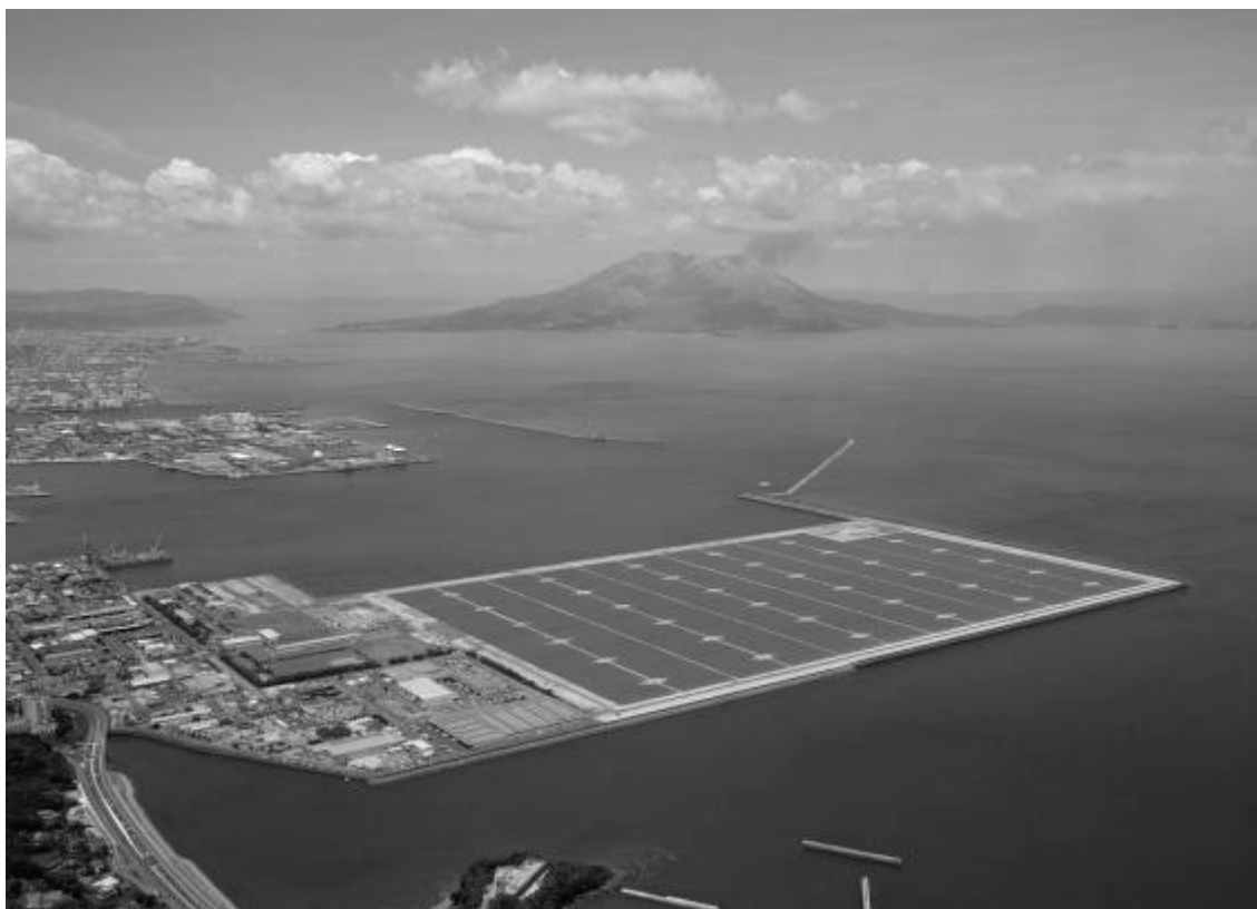
鹿児島七ツ島メガソーラー発電所

市民みんなで美しいまちづくりを進めるとともに、雄大な桜島や錦江湾、郊外に広がる田園風景や清らかな川、鮮やかな緑など豊かな自然に恵まれ、すべての市民が潤いと安らぎを感じながら快適な生活を送ることのできる、人と自然が共生する環境を創出します。