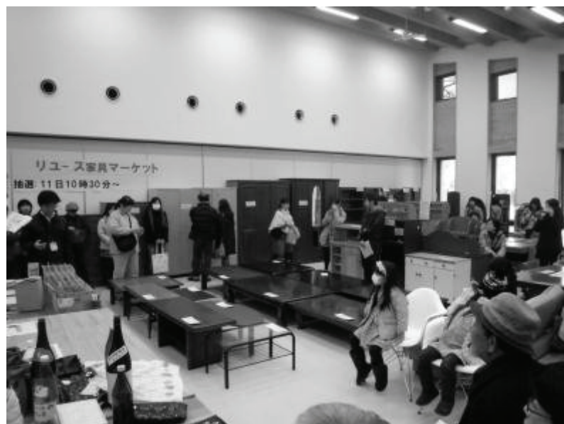
リユース家具マーケット