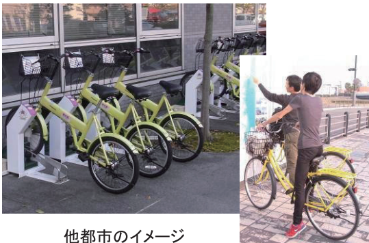
他都市のイメージ

自家用車等から環境にやさしい自転車プラス公共交通による移動への転換を促進し、温室効果ガス排出量の削減などを図るため、市内中心部に設置する複数のサイクルポートで、どこでも自転車の貸出・返却ができるコミュニティサイクル事業を実施する。