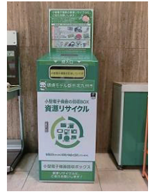
他都市のイメージ

レアメタル等の資源の有効活用を図るため、公共施設等に回収ボックスを設置し、携帯電話やデジタルカメラなどの使用済小型電子機器等のリサイクルを開始する。