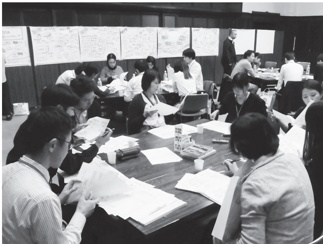
次期総合計画策定にかかるワーキンググループの開催

地域の自主性及び自立性を高めるための改革が進む中、効率的で質の高い市民サービスの提供、将来を見据えた健全な財政運営、市域を越えた広域的な連携などを通して、創意と工夫に満ちた自主的・自立的なまちづくりを進めます。