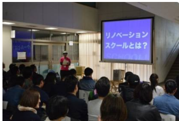
リノベーションスクールの様子