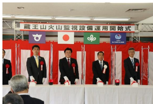
蔵王山監視設備運用開始式

令和4年5月9日に、蔵王山火山監視設備運用開始式が行われました。蔵王山の状況を常時監視することにより、迅速な初動対応が可能となりました。