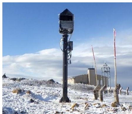
設置した監視カメラ