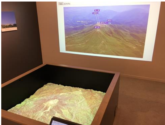
▲模型を使ったプロジェクションマッピング

※同日、王滝村王滝口登山道入口に長野県立御嶽山ビジターセンター「やまテラス王滝」もオープンしました。