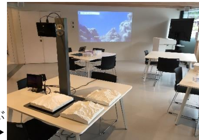
会議や火山について学ぶことができる多目的室▶