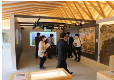
▲御嶽山に関する歴史、文化、地質などを紹介する展示