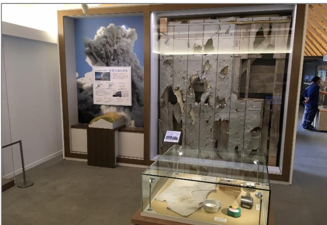
▲被災した剣ヶ峰祈禱所の壁と被災者所持品の実物展示

「木曾町御嶽山ビジターセンターさとテラス三岳」 開館時間：9:00 - 16:00 休館日 年末年始 入館料 無料 TEL：0264-24-0197 E-mail：mitake-vc@visitkiso.com