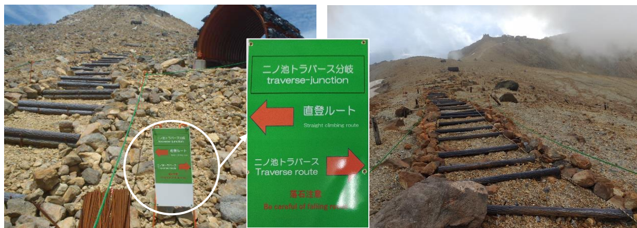
登山道と立入規制ロープ・案内看板