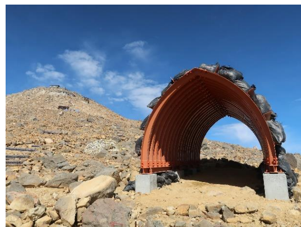
新設した避難シェルター