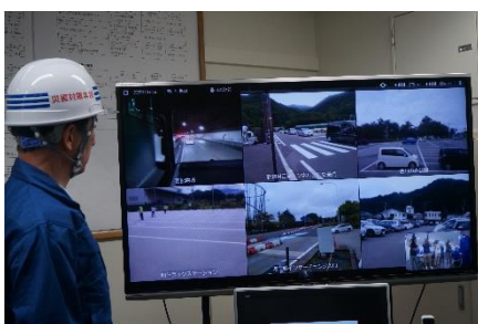
リアルタイム映像による避難路状況等の監視