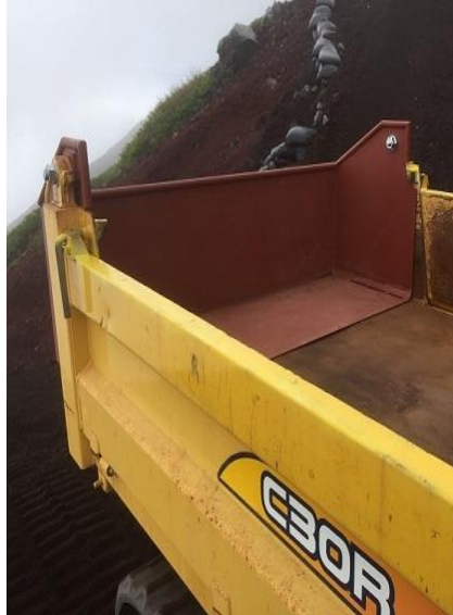
クローラ架台伸長器具 (バックボード積載用)