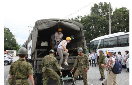
自衛隊等協力による住民の広域避難訓練