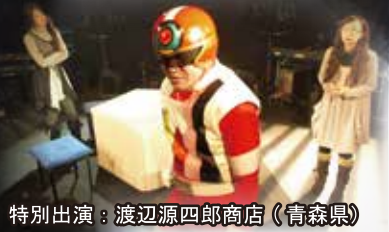
特別出演：渡辺源四郎商店（青森県）