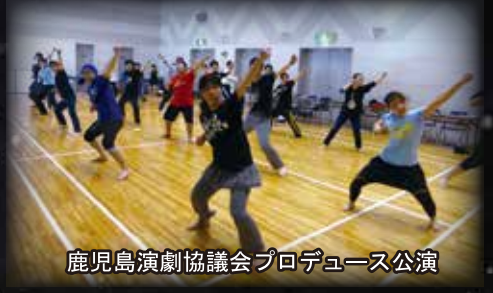
鹿児島演劇協議会プロデュース公演