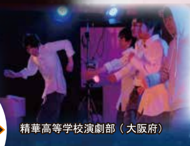
精華高等学校演劇部（大阪府）