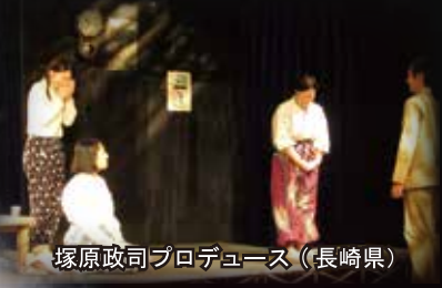
塚原政司プロデュース（長崎県）