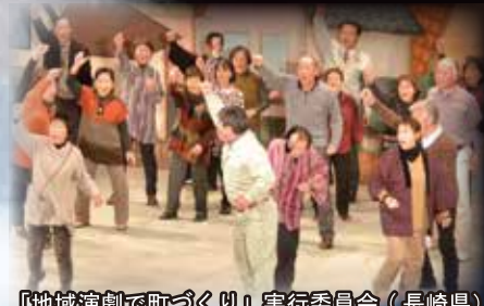
『地域演劇で町づくり』実行委員会（長崎県）