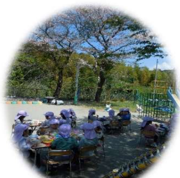
園庭でお花見給食