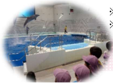
お別れ遠足 水族館へ