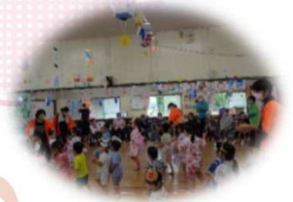
地域の方々と夏まつりごっこ

入園式 保育参加 個人面談 七夕会 夏まつりごっこ 十五夜会 合同運動会 親子遠足 発表会 クリスマス会 豆まき会 お別れ遠足 ひな祭り会 お別れ会 卒園式 等