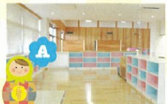
■エントランスホール