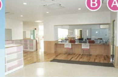
■エントランスホール・受付