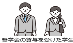
奨学金の貸与を受けた学生