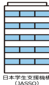
日本学生支援機構 (JASSO)