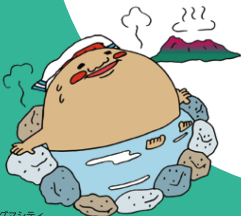
マグマシティ PRキャラクター 火山の妖精「マグニオン」