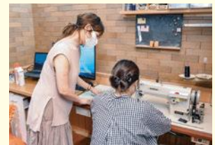
自宅に構える工房にはミシンを備え、縫製まで行う

利用前はハードルが高いイメージがありましたが、産業支援課の担当者から丁寧な説明を受け、スムーズに申請することができました。利用後もほかの補助制度やイベント、セミナーなどを案内いただけてとても助かっています。事業展開がはっきりと決まっていなくても、まずは気軽に相談されることをお勧めします。