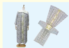
商標権を取得した「平面パジャマ」。素材や色味は発注者の好みを聞いて製作する