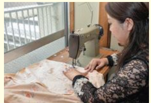
全ての工程を手作業で行う

知的財産権は必ず取得できるものではありませんが、支援事業のおかげで思い切ってチャレンジすることができました。申請方法も鹿児島市の担当者から分かりやすくアドバイスしていただきました。現在は、自社のホームページを見やすくリニューアルするため、再度支援事業に申請中です。リスクがあっても、未来に光を灯してくれるような支援事業を積極的に利用し、新しいことにチャレンジすることをお勧めします。