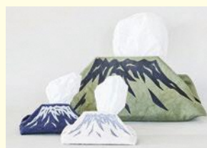
支援事業を利用しリニューアルしたMOKMOKティッシュケース