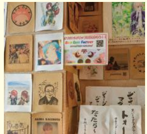
「推しカフェファクトリー」で作られたオリジナルパッケージ