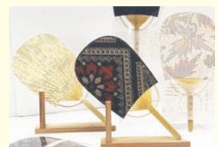
市長賞を受賞した南風扇