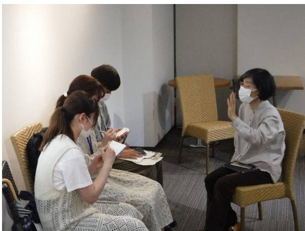
(ガーデンズシネマ)