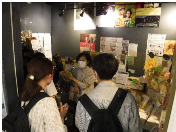
(ガーデンズシネマ)