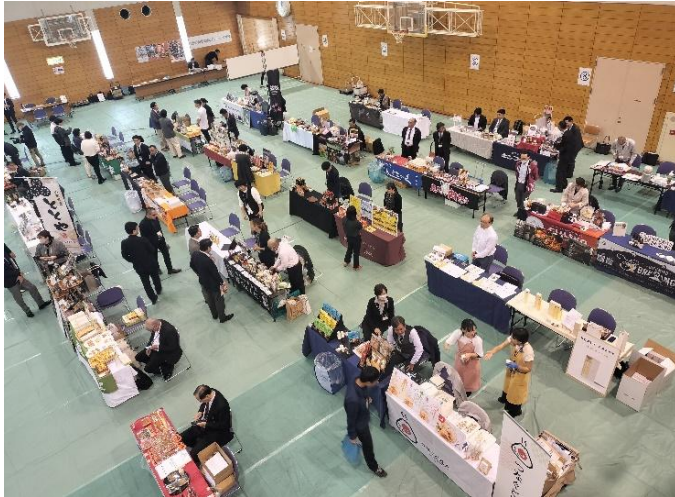
鹿児島市食料品製造業ビジネスマッチング商談会