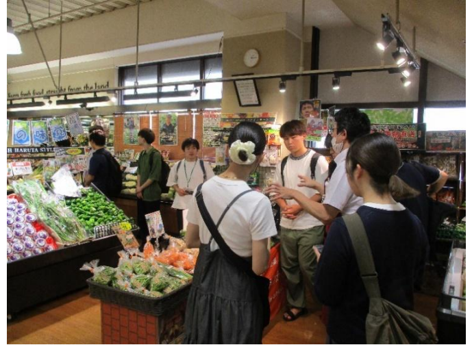
大学連携による繁盛店づくりコンサルティング事業

創業者・中小企業者の皆さまに対する公的な資金支援や経営に役立つ情報を掲載しています。 詳しい内容は、お問合せください。