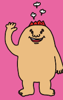
マグマシティPRキャラクター マグマニョン