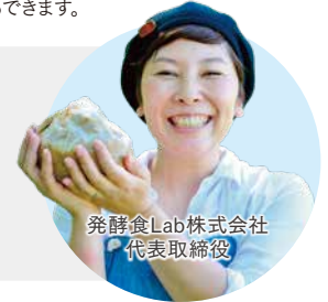
発酵食Lab株式会社 代表取締役

2013年、約13年間社会人生活を送った東京を離れ、鹿児島県薩摩川内市上甕に移住。地域おこし協力隊として、島内の農業者、漁業者、加工業者、小売店、飲食店とタッグを組み、ブランディングや商品開発、販路開拓を行う。3年間の協力隊任期を終えた後も、鹿児島の豊かな自然と食文化を活かし、付加価値の高い商品・サービスを生み出そうとする事業者に向け、実践から得たノウハウにより商品開発のプロセスを整理し『売る』ための基礎を整える支援を行っている。